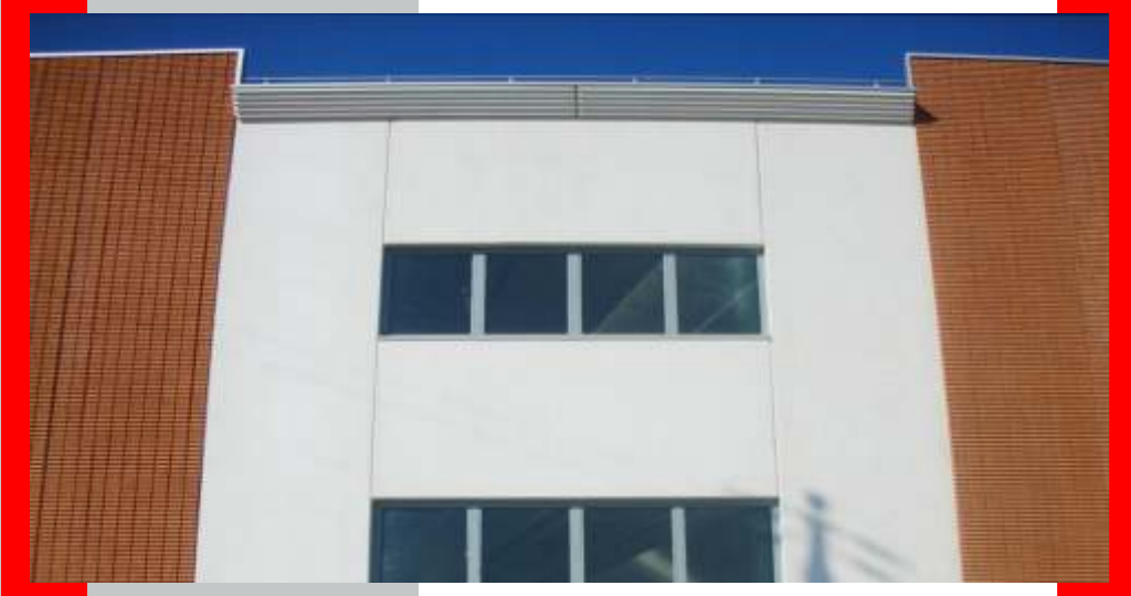
CORNICIONI IN CLS elemento prefabbricato dalla forma dentellata, di grande impatto visivo.