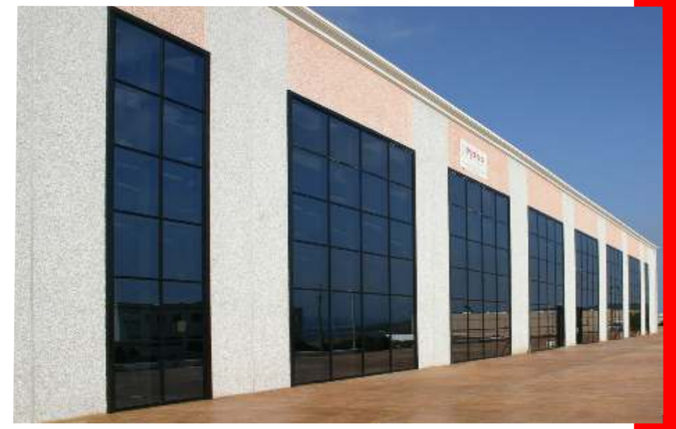
CORNICIONI ACCEM sono elementi continui in lamiera trattati con malta cementizia colore bianco, e possono essere utilizzati in sostituzione al classico cappuccio in lamiera preverniciata.