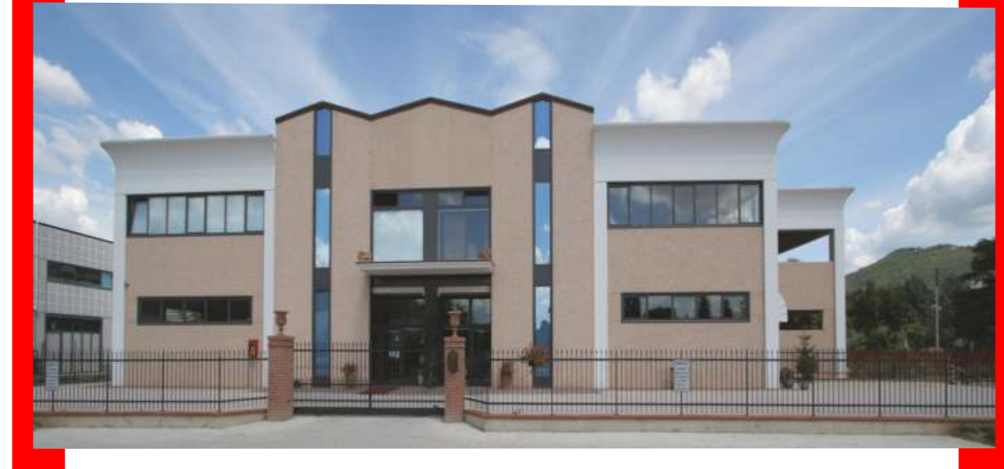
Immagine in alto : edificio con trave veletta a coronamento