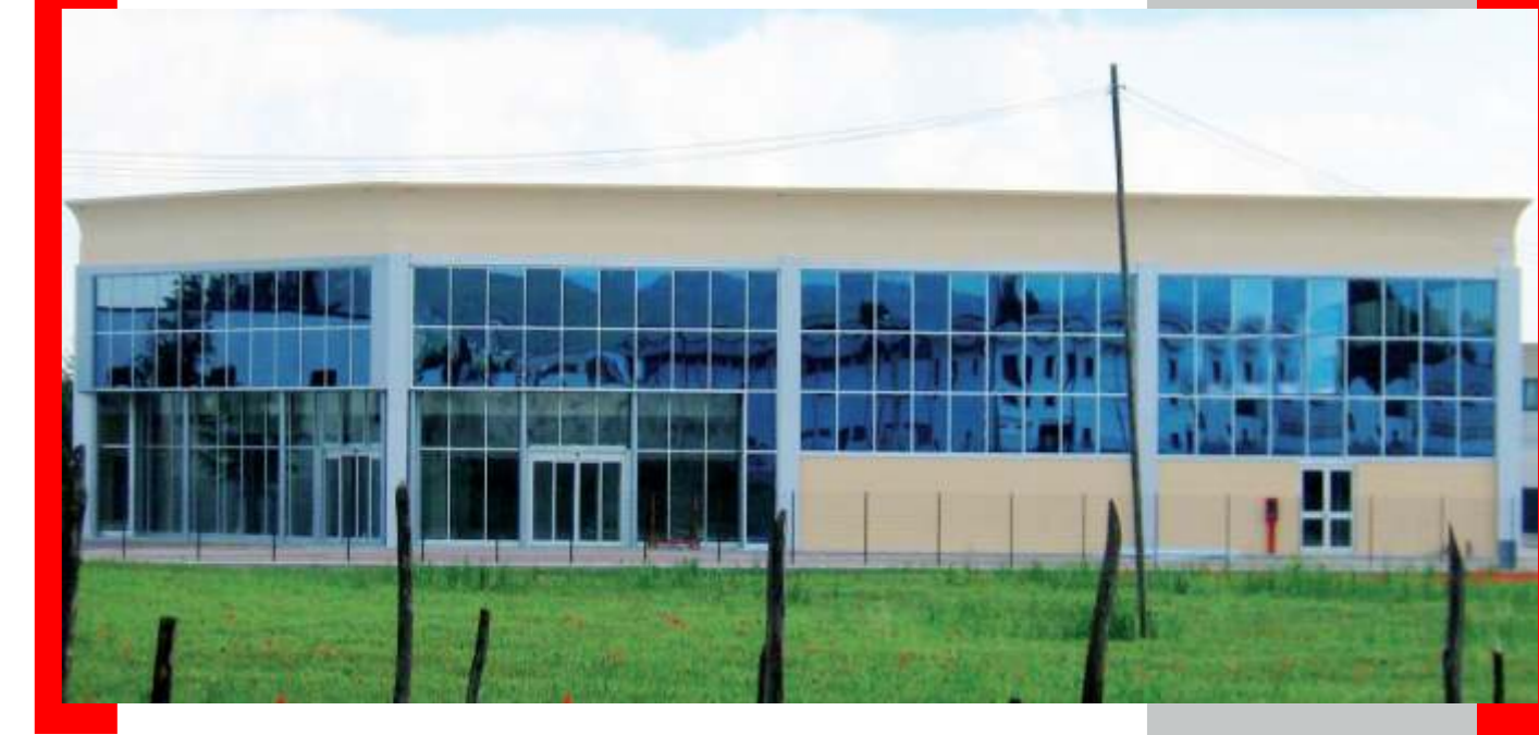
Immagine sopra e sotto: edificio con trave veletta