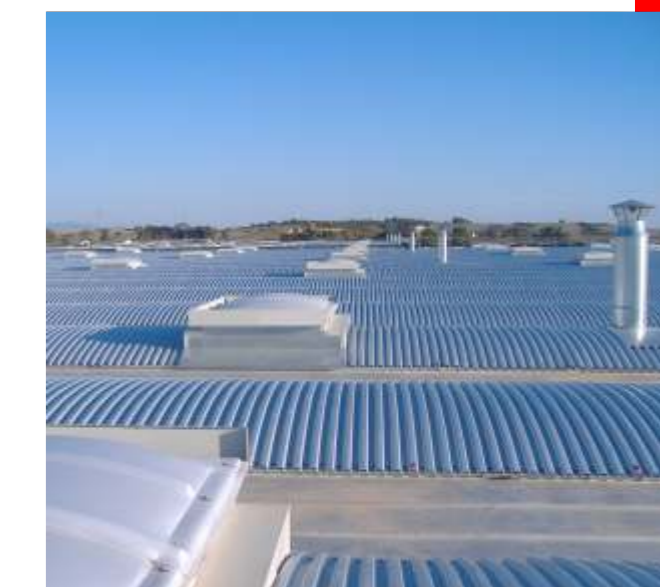
Immagine panoramica: copertura President con lucernario Immagini: copertura President soluzione piana

Tra tegolo e tegolo vengono disposte lastre di plafonatura coibentate sormontate da lastre di copertura in aluzinc. L'intercapedine che si viene a creare costituisce una camera di aereazione effetto "tetto freddo" con conseguenti benefici effetti a livello di comfort termico interno.