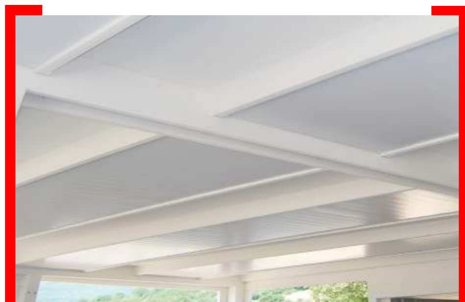
Immagine in alto e a lato: vista intradosso President con lastra dogata