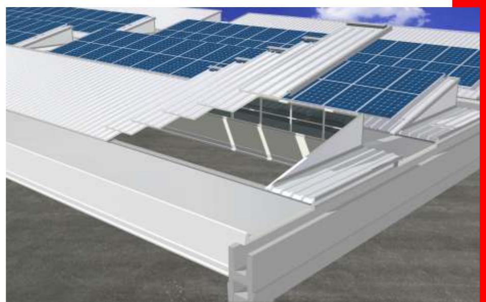
Immagine a lato: schema di composizione soluzione con impianto fotovoltaico