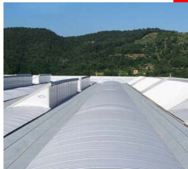
Immagini : President con Macroshed

La notevole ampiezza della zona piana offre grande possibilità dal punto di vista della praticabilità e della installazione di impianti e macchinari.